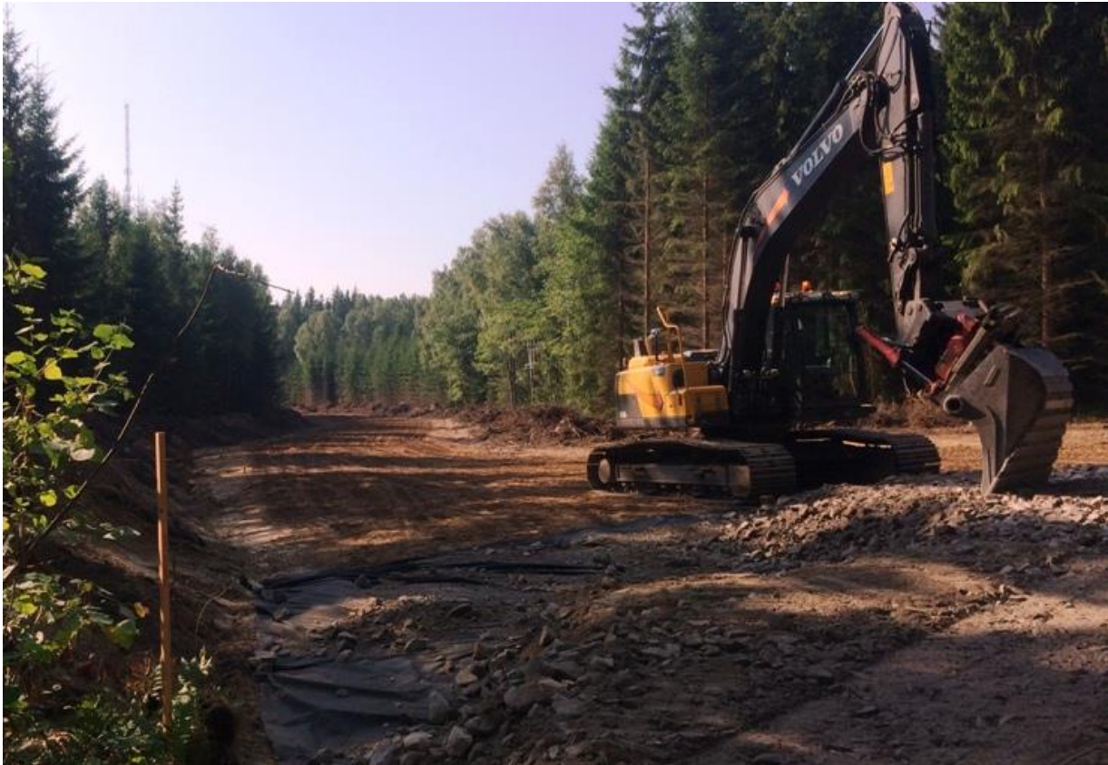
Figur 6. Foto av vägbygget 17 augusti 2022 riktning söderut från position D.

Av villkoren i beslutet framgick att åtgärden tidigast skulle få påbörjas fyra veckor efter att beslutet har kungjorts, vilket skulle innebära 6 oktober. Avverkningen av skogen hade i själva verket påbörjats i början av juli och Figur 5 visar att ett stort område i skyddszonen avverkats den 17 juli. Av Figur 6 framgår att vägbygget kommit tämligen långt den 17 augusti. Detta innebär att "åtgärden" påbörjats nästan 3 månader innan den var tillåten