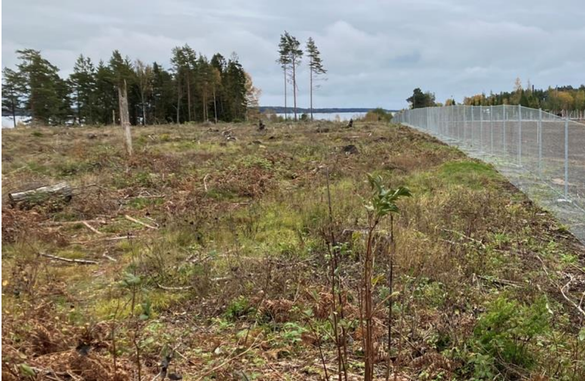
Figur 4. Foto från position B söderut.

Figur 4 visar ungefär samma vy sett från position B, men här syns vattenytan ännu tydligare. Staketet till höger i bilden är nyuppsatt och verkar ungefärligen följa den inre gränsen för skyddszonen.