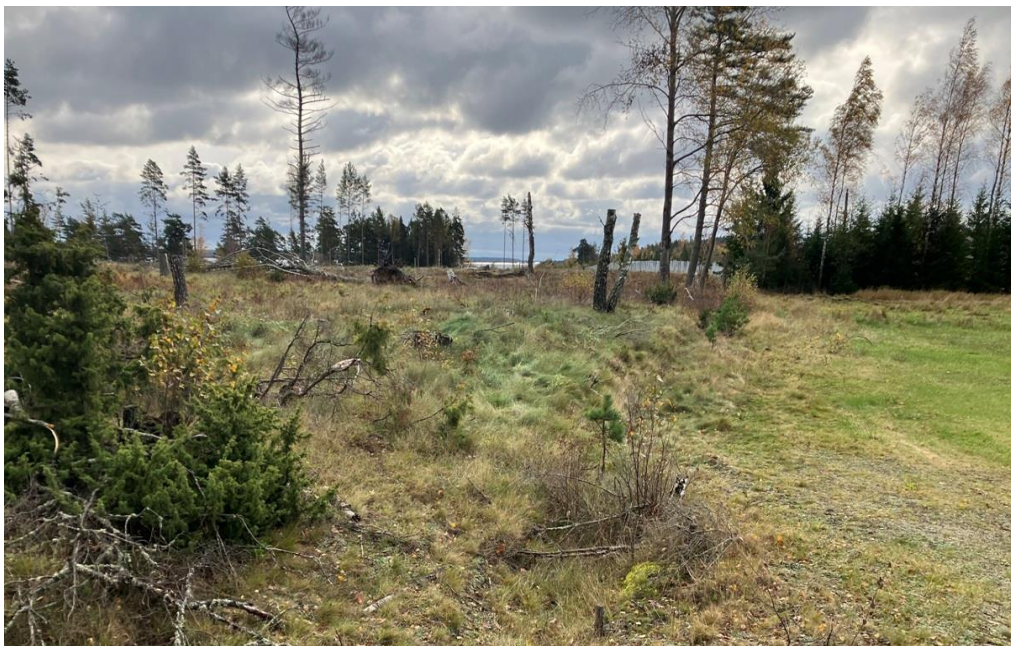
Figur 3. Foto från position A söderut (från oktober 2023)