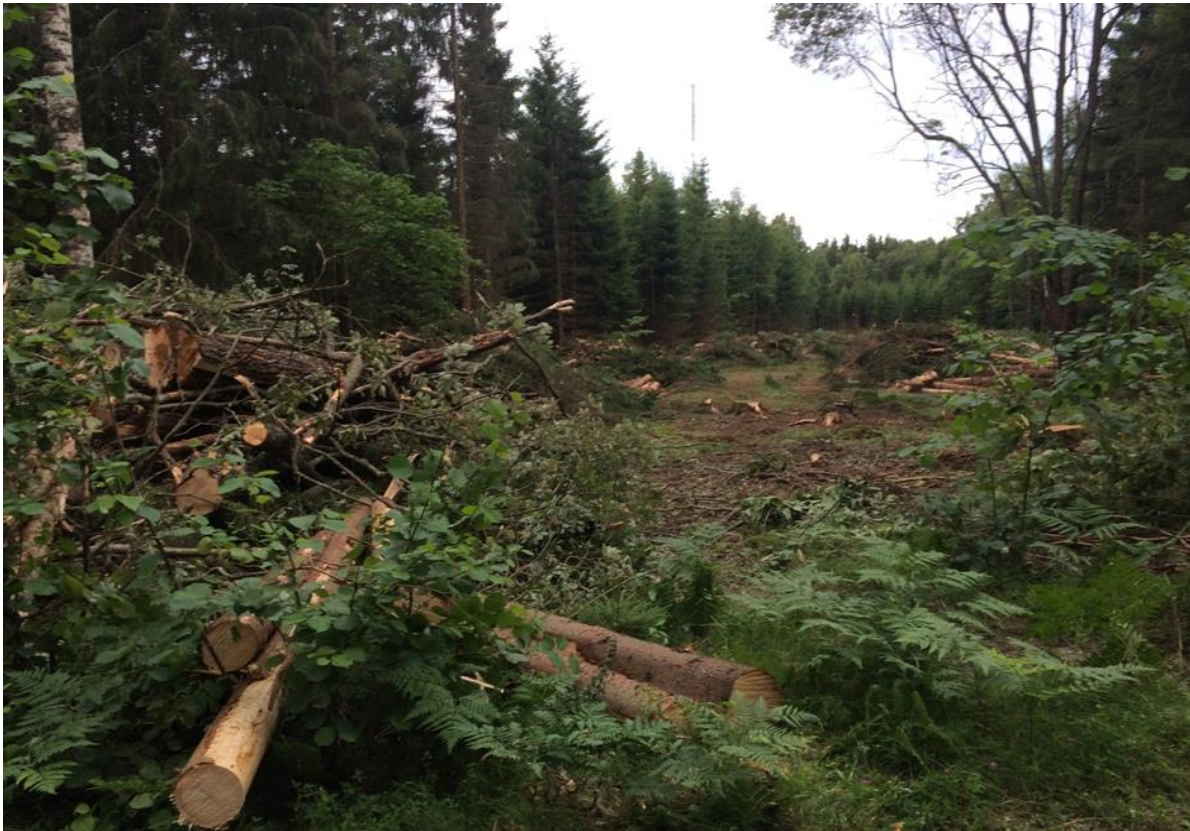
Figur 5. Foto av hygget 17 juli 2022 riktning söderut från position D.

Vid position D har en ny väg dragits fram med start sommaren 2022. Den nya vägen är en avstickare från en äldre väg som leder från Tranvik till Byggninge. Vägbygget och tillhörande trafik skulle avsevärt påverka den gamla vägen, vilken är en gemensamhetsanläggning som berör fyra fastigheter.